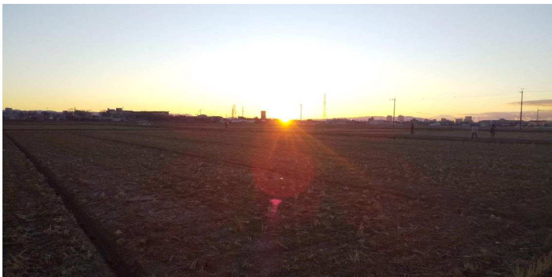
2022年1月1日。谷田神社付近から望む初日の出。